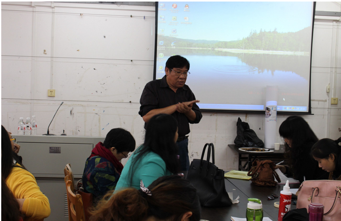
雷务武教授现场授课

2014年11月9日上午8点40分，在广西艺术学院桂林中国画学院教学楼402教室，中国美术家协会会员、中国版画家协会常务理事以及国家教育部“国培专家库”专家雷务武教授为学员们耐心讲述并演绎了综合材料版画课程。雷务武教授平易近人，他的授课方式及内容也让学员听得尤为踏实。